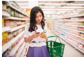
Etiqueter ses produits au format INCO