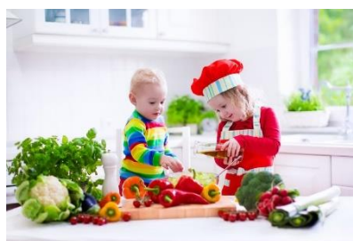
Formuler des produits pour enfants et adolescents