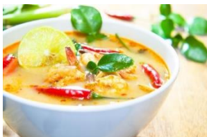
Formuler des produits pour personnes âgées fragiles