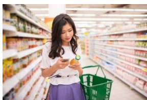
Etiqueter ses produits au format INCO