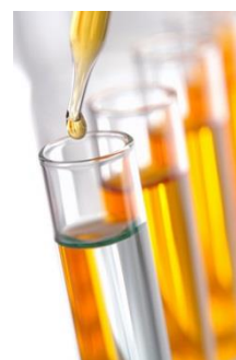
Plans d'analyses et de contrôles

N'hésitez pas à nous solliciter pour d'autres formations en lien avec la thématique nutrition, nous étudierons votre demande.