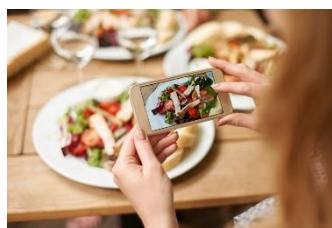
Digitalisation en Nutrition-Santé