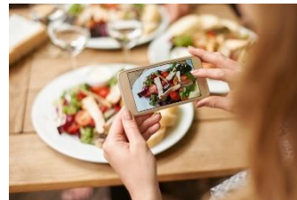
Digitalisation en Nutrition-Santé