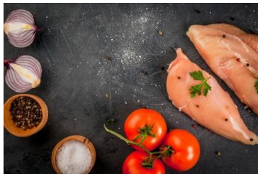
Formuler des produits pour sportifs