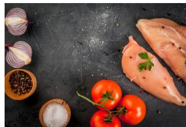
Formuler des produits pour sportifs