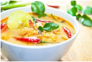
Formuler des produits pour personnes âgées fragiles