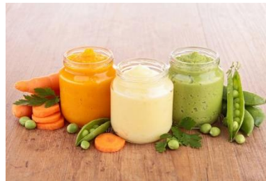
Formuler du baby food